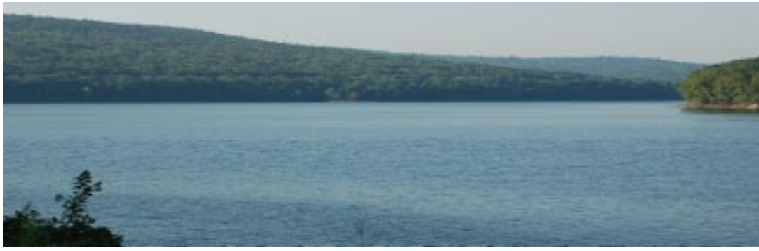
Depósito Montaña Cobble

La Comisión de Acueductos y Alcantarillados de Springfield provee este informe para cumplir con los requisitos estipulados por la ley federal y estatal sobre el agua potable y si es segura para tomar. Este informe se desarrolla interno y cada copia tiene un costo de 37 centavos que incluye la imprenta y envío por correo.